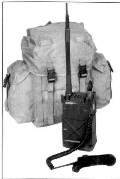
AN/PRC-119E, la version portable du SINCGARS d'ITT. Le même appareil est couplé à un amplificateur pour être monté dans un véhicule.

Deuxièmement, la miniaturisation. Le passage de l'analogique au numérique, s'il s'est accompagné d'un substantiel accroissement de performances, ne semble pas avoir amené la miniaturisation souhaitée. Même si le passage de la SE-412/SVZ-B à la SE-235, m2+ représente une réduction de volume et de poids de l'ordre de 75%, ce qui n'est pas négligeable ! A l'avenir, au fur et à mesure que l'on s'approchera de l'idée du combattant numérique, ces contraintes vont devenir draconiennes. Les radios du futur, comprenant l'interfa-