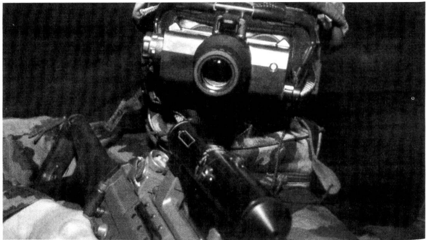
Avec les crédits à disposition, le concept «Armée XXI» est-il réalisable? Ici un appareil de visée nocturne pour le Fusil d'assaut 90.

Die Konsequenzen des Mangels an Berufspersonal für die künftige Armee sind gravierend. Nebst der hohen Belastung der vorhandenen Berufskader in den künftig dreimal beginnenden Schulen, fehlen insbesondere diejenigen Auszubildende, welche die Miliz entlasten sollten. Von den ursprünglich angekündigten Umschulungskursen für die ersten WK-Jahre unter der Leitung der Lehrverbände ist wenig übriggeblieben, das heisst diese müssen unter der Verantwort-