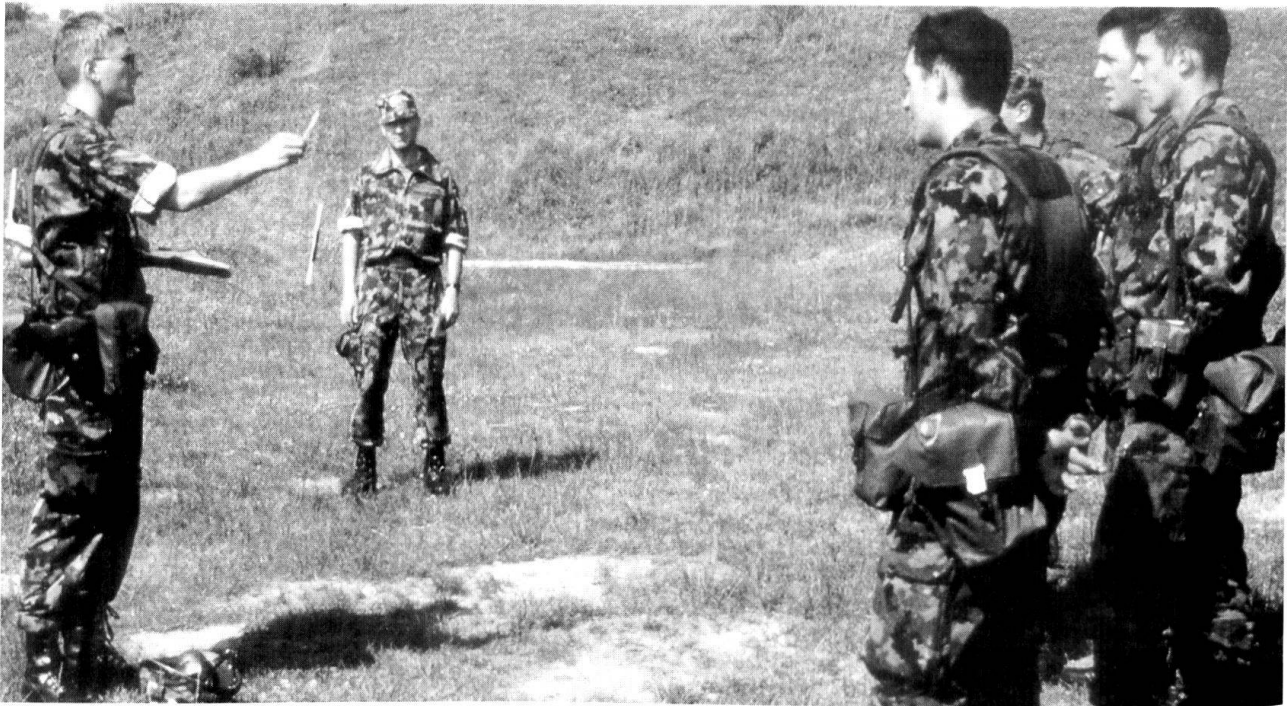
L'Armée XXI exige un accroissement du nombre des instructeurs, de cadres contractuels et d'officiers subalternes. Va-t-on les trouver ?