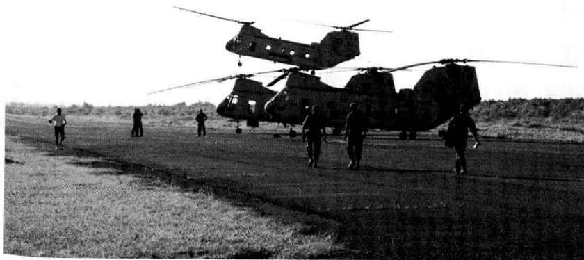
Les hélicoptères américains amènent les blessés à l'A.C.A.

assourdis par le bruit conséquent des deux turbo-propulseurs de notre Hercule C 130 : en somme, vive les vols charters! Nous atterrirons en Géorgie en fin de journée. Il y a trois heures de décalage horaire, ce qui nous plonge rapidement dans l'obscurité.