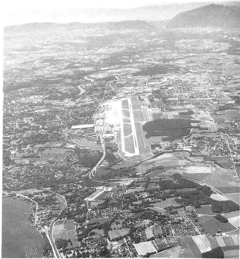
Une infrastructure «sensible» dans le secteur du CA camp 1: l'aéroport de Genève-Cointrin.

Foisonnant d'informations diverses, Le temps des mutations est aussi un bel ouvrage, en raison de la qualité de son graphisme et de ses illustrations