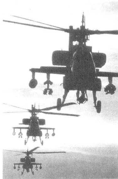
... la mobilité non plus.

La France a défendu le respect de la légalité et de la légitimité internationales, soit. Mais elle a pêché en ne proposant pas une solution alternative aux certitudes de l'administration américaine. Et que veut dire concrètement « rendre le pouvoir aux Irakiens », au vu