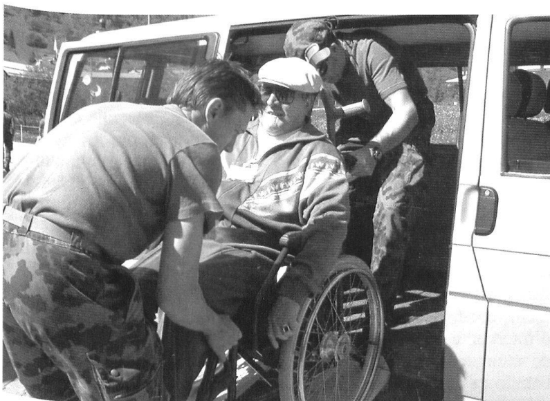
Camp de l'armée pour handicapés à Fiesch: des militaires du régiment d'hôpital 12 préparent leurs hôtes pour un déplacement.

Des moyens militaires sont engagés dès le lundi 27. Il s'agit de formations issues des écoles de recrues de protection aérienne 276 et 277 ainsi que d'un détachement de l'École de recrues du génie 256. L'engagement dure jusqu'au 29 octobre. Finalement, ce sont plus de 1500 militaires qui fournissent 14000 jours de travail au profit de la commune de Brigue et des communes avoisinantes. Les formations engagées – des formations de PA, de police de route, du génie, de l'infanterie et des cyclistes – l'ont été pour des tâches de déblaiement, de sécurité et de remise en état.