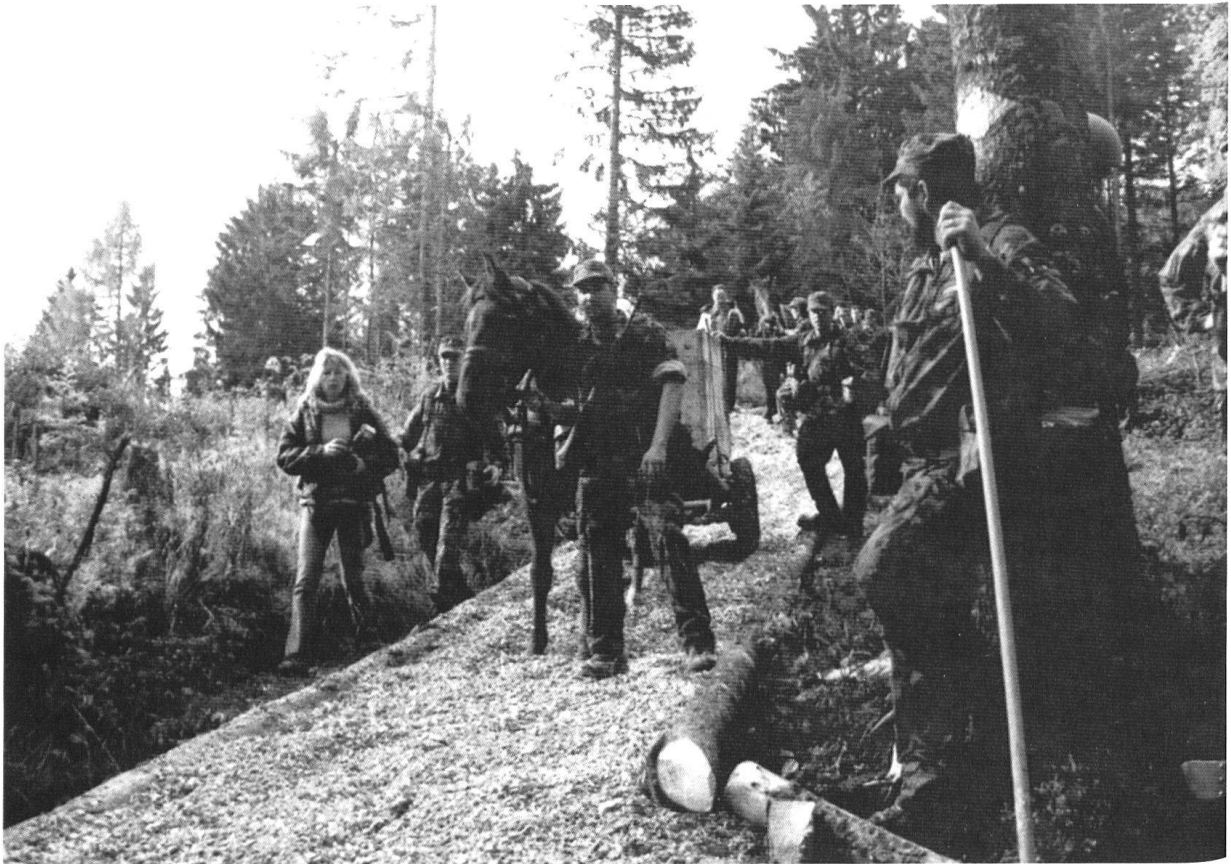
Les hommes de la colonne du train IV/10 en action au-dessus des Pléiades.

«Armée 95», qui sera dissous à la fin de cette année.