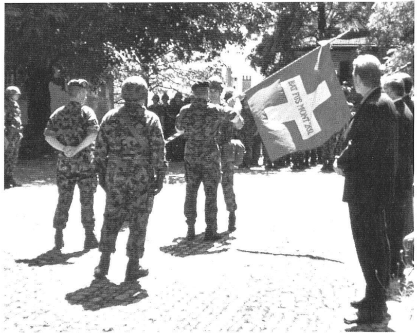
Le jeudi 11 juillet 2002, place Marjorie à Sion, le commandant du bataillon de fusilliers de montagne 202 remet son drapeau à son commandant de brigade.

Le groupe vétérinaire 6 existe à la zone territoriale 10 depuis 1971. Lors de la réforme «Armée 95», il perd simplement sa compagnie d'état-major. Avec l'état-major de brigade et le bataillon d'état-major (lequel a toutefois vu ses structures internes fortement évoluer), il forme le trio des for-