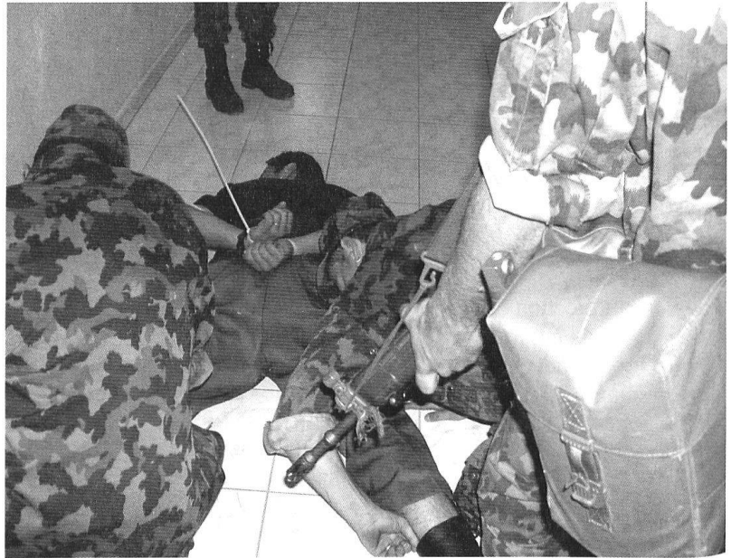
Exercice «HELIOS»: la vigilance des soldats du régiment territorial 10 n'a pas été prise en défaut.

Samedi 14 octobre 2000, peu après 10 heures: une immense coulée de boue coupe le village de Gondo en deux. 13 habitants du village sont portés disparus. C'est à mon tour de conduire l'aide militaire au profit du canton du Valais. A 12 heures 30, je participe à Sion à la première séance de la cellule catastrophe du canton. L'aide de l'armée est immédiatement demandée et les premiers éléments – éléments de reconnais-