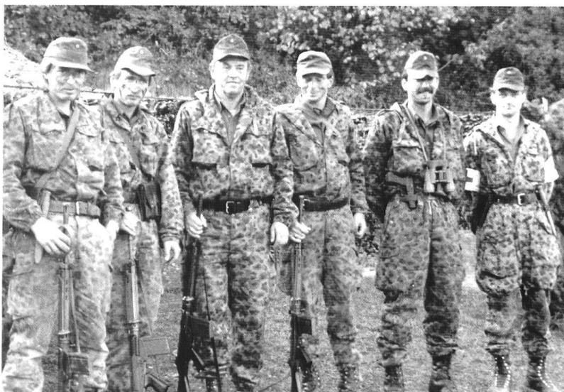
Une raison de scepticisme : si l'armée austro-hongroise et la puissante armée allemande ont été vaincues, comment la petite armée autrichienne pourrait-elle gagner une guerre ?

catif, par la représentation de leurs propres intérêts, pour qu'ils puissent finalement aussi se faire accepter.