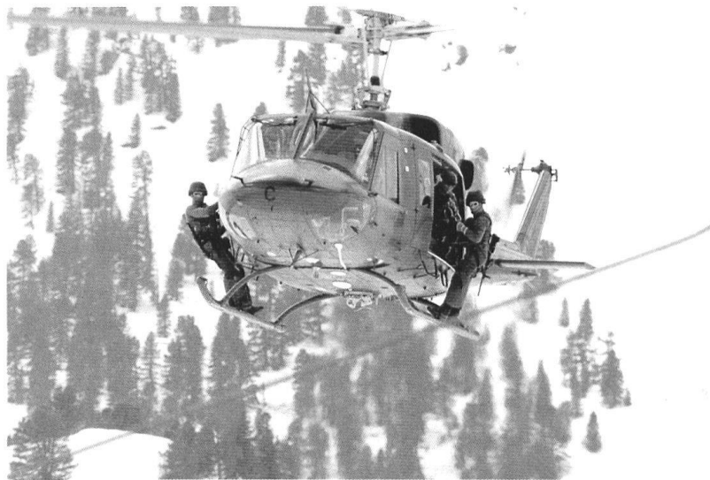
La politique de l'image doit prendre en considération le lien étroit qui existe entre l'image et la réalité.

Les images apparaissent rapidement et changent tout aussi rapidement. Cela est dès lors aussi bien leur risque que leur avantage: elles peuvent être corrigées. L'image a une importance particulière, peut-être démesurée dans la formation