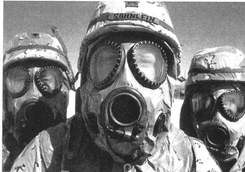
Guerre du golfe : soldats américains en tenue NBC.

Si la Deuxième Guerre mondiale n'est pas marquée par l'engagement d'armes chimiques, elle contribue pourtant à des développements majeurs du droit international humanitaire. C'est à nouveau à Genève que sont adoptées, le 12 août 1949, les quatre Conventions codifiant le droit des conflits armés et leurs Protocoles additionnels. Les principes coutumiers, déjà énoncés dans les conventions antérieures, sont repris pour