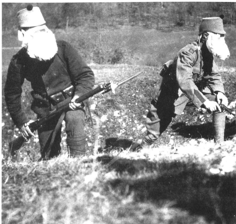
Soldats suisses pendant la Première Guerre mondiale, avec un premier équipement de protection contre les gaz.

En 1868, la Déclaration de Saint-Petersbourg, suite à une proposition russe, interdit l'utilisation de projectiles légers explosifs ou inflammables. En 1899, toujours à l'instigation du Tsar, les nations européennes