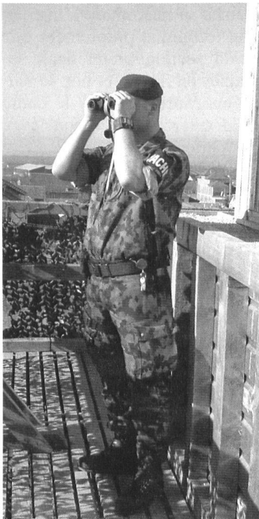
La garde fait aussi partie des missions de la section.

Le passage rapide d'un état de préparation «jaune» à «rouge», l'exercice de missions de sécurité au sein d'une population civile pas forcément hostile mais qui représente toujours des risques... Rien de neuf pour un policier, mais beaucoup d'éléments à maîtriser