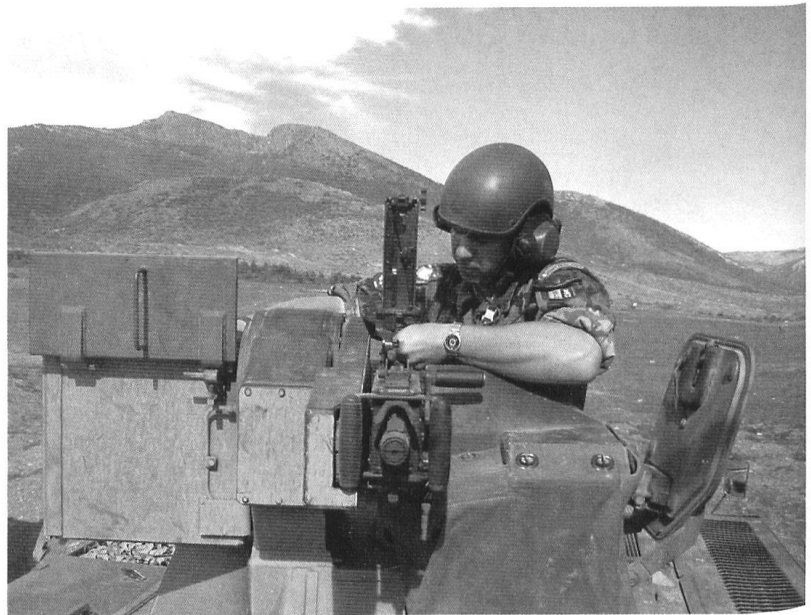
Même à l'engagement, l'instruction ne doit pas être oubliée.

pour un fusilier disposant en sus de l'appui d'une mitrailleuse lourde prête au tir!