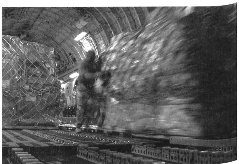
L'avion de transport américain C-17 peut embarquer près de 80 tonnes de fret sur une distance de 4440 ou 8700 km (convoyage).