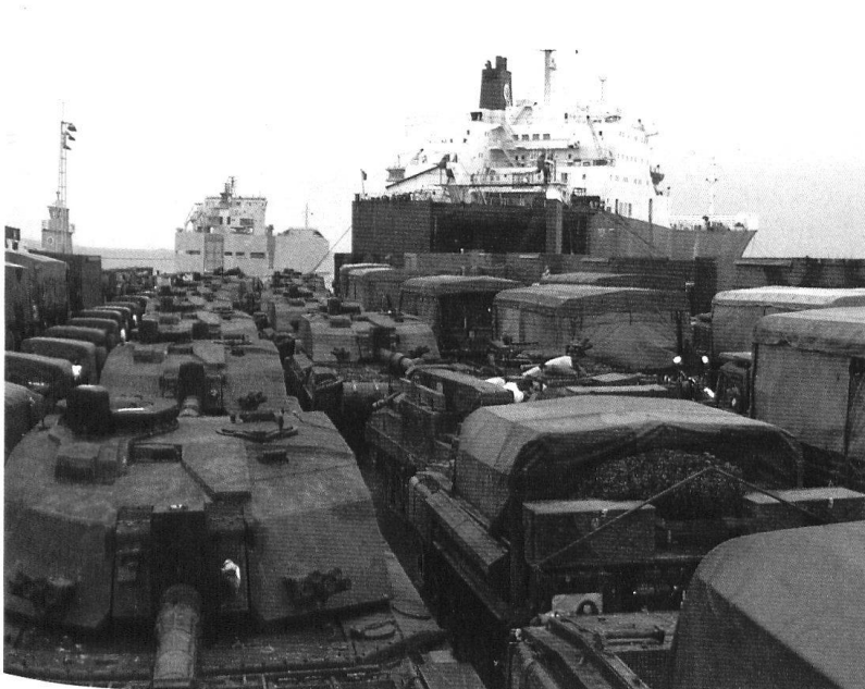
Une partie des véhicules de la 7 e brigade blindée britannique («les Rats du désert») chargés à Emden (D).

Cette appréciation s'est appliquée à deux domaines, alors que les Anglo-Américains ont déployé plusieurs centaines de systèmes d'armes, allant du fusil d'assaut au missile Tomahawk . Une division comme la fameuse 3 e division d'infanterie mécanisée, le fer de lance de l'offensive terrestre américaine, aligne quelque 650 véhicules à chenilles, sans compter les véhicules à roues (les énormes jeeps Hummer , les camions-citernes, les camions de transport, etc.).