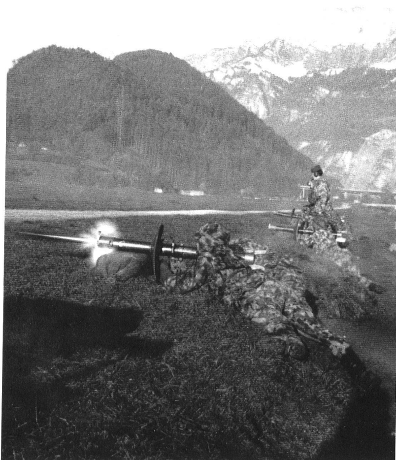
Tir au tube roquette.

En 1944, comme en 1940, la menace sur le front Nord-Ouest touche directement la ville de Bâle et l'Ajoie. Refusant de s'y laisser aspirer dans un engagement qui serait préjudiciable à la défense générale du pays, Guisan est résolu à riposter à toute attaque par des mesures immédiates et efficaces. A cet effet, les brigades légères 1 et 2 sont relevées en Ajoie par la 2 e division. En obligeant le commandement suisse à rappeler, simultanément ou successivement, sous les armes ses Grandes Unités, et à en engager le plus grand nombre, la campagne de 1944-1945 permet de vérifier que la troupe n'a pas perdu de son efficacité dans le Réduit.