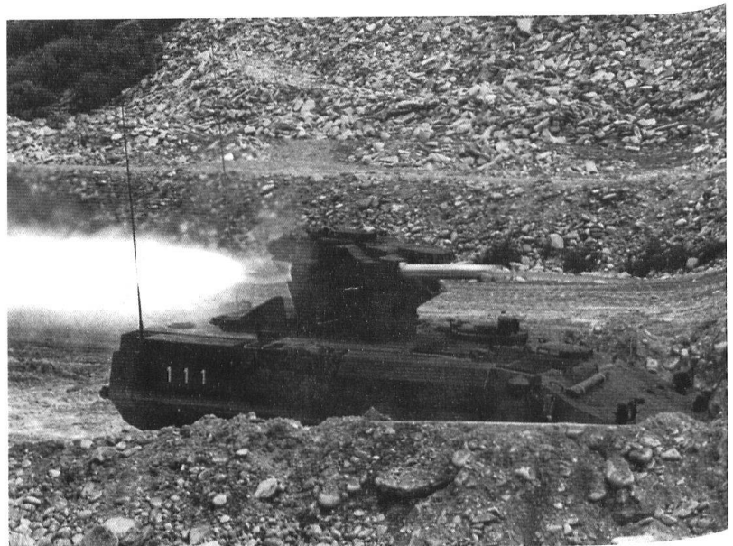
Le chasseur de chars Piranha.

tour de rôle: par exemple une brigade de landwehr avec un régiment d'infanterie d'élite.