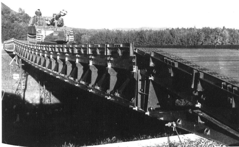
Un obusier blindé sur un pont fixe 69.

plusieurs victimes en 1975. Un nouvel équipement d'hiver venait pourtant d'être distribué avec du matériel supplémentaire destiné en priorité aux troupes de montagne. L'initiation à la pratique du ski, l'instruction antichar, le travail de nuit, l'instruction au service de garde, le tir, les relations plus personnelles qui s'établissent dans des conditions difficiles confèrent aux cours d'hiver de la division frontière 2 un caractère particulier.