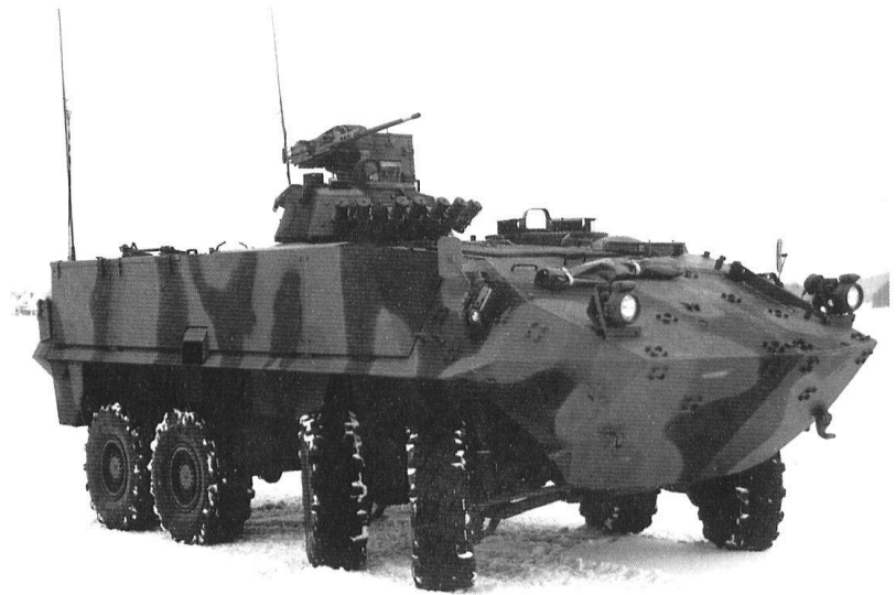
Le char de grenadiers à roues.

Dans le domaine de l'instruction, la collaboration interarmes fait l'objet, depuis de longues années, d'exercices et de manœuvres. Elle s'intensifie en fonction de la complexité croissante des matériels. Depuis les années 1970, des engagements conjoints de troupes de formations différentes se déroulent chaque année, à des saisons différentes et concernent toutes les formations à