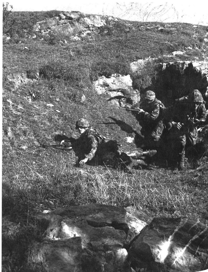
Prêts pour l'assaut...

Le 20 juin 1940, au moment où les premiers éléments du corps français du général Daille franchissent la frontière, le 1 er corps roque sa 2 e divi-