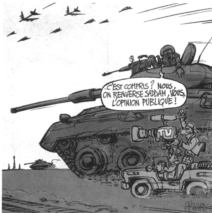
Guerre des images : les médias sont en premières lignes. Vu par Richards. (Coopération, 26 mars 2003).

L'évaluation des possibilités d'actions adverses est un élément central de toute planification. Traditionnellement, le renseignement militaire se concentre sur les moyens disponibles en personnel et en matériel pour en déduire les capacités des forces opposées; l'intention de leurs chefs est prudemment délaissée, en vertu du principe qu'il est plus simple – donc bien plus probable – de changer d'intention qu'obtenir des capacités différentes. Face à des formations armées régulières, organisées en fonction d'une mission, unifiées par une doctrine homogène, cherchant à atteindre les buts stratégiques fixés par l'échelon supérieur et astreintes aux lois de la guerre, cette méthode a fait ses preuves. Le nombre d'actions susceptibles d'être entreprises par une brigade mécanisée, une escadrille de chasseurs-bombardiers ou une frégate lance-missiles reste limité. Les performances de leurs équipements peuvent être quantifiées dans l'espace et dans le temps, numérisées avec précision et utilisées dans une simulation infor-