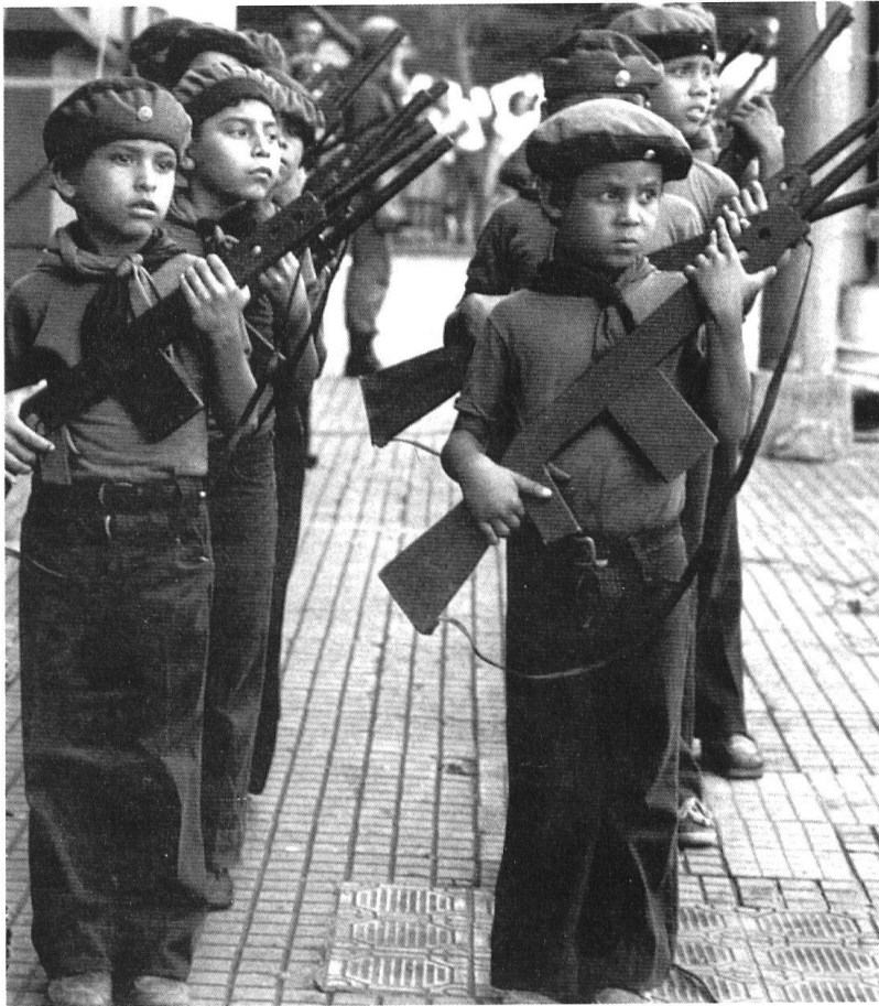
Enfants au Nicaragua : s'exercer à la guerre.

En effet, les acteurs non étatiques n'ont pas une meilleure compréhension des conflits modernes : des connaissances périssables et relatives, issues de l'expérience, ne constituent pas, à elles seules, une doctrine digne de ce nom. Malgré toute la rhétorique sur la guerre révolutionnaire en vogue dans les années 50 et 60, les guérillas atteignent rarement leurs objectifs stratégiques ; aujourd'hui, elles sont des organisations plus criminelles que politiques. Furieusement à la mode dans les années 70 et 80, le terrorisme