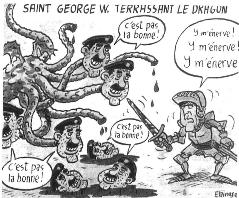
L'Express, 31 mars 2003.