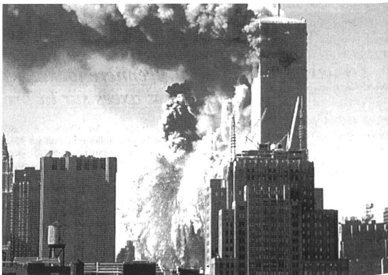
Depuis les attentats du 11 septembre 2001, la peur n'a jamais été aussi présente dans le monde des médias.

Enfin, le tempo et l'intensité des conflits modernes sont à l'opposé des guerres conventionnelles 2 . De nos jours, les forces gouvernementales ne doivent pas réagir à des engagements tactiques s'enchaînant à grande vitesse, mais prévenir des actions d'ampleur stratégique largement espacées dans le temps. La portée et la précision des armements modernes ont raréfié et raccourci les conflits symétriques, en donnant aux armées digitalisées un a-