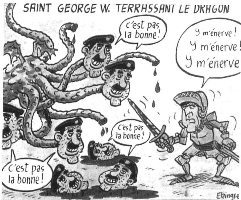
L'Express, 31 mars 2003.