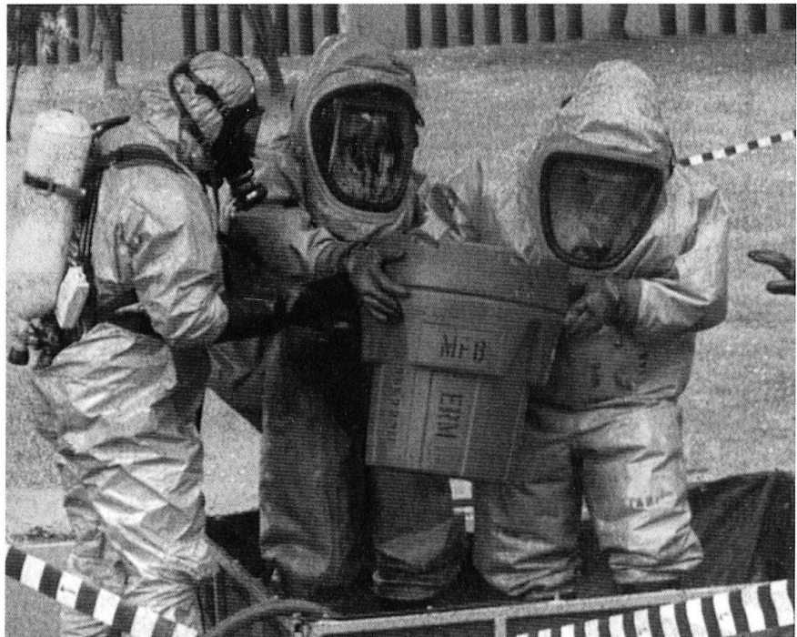
Un attentat à l'arme chimique vise à un «massacre de masse».

Le discours idéologique utilisé pour cristalliser la haine de certains, afin de la diriger contre d'autres, présentés comme «la Menace», a toujours la prétention de tout expliquer et ordonne les faits en une procédu-