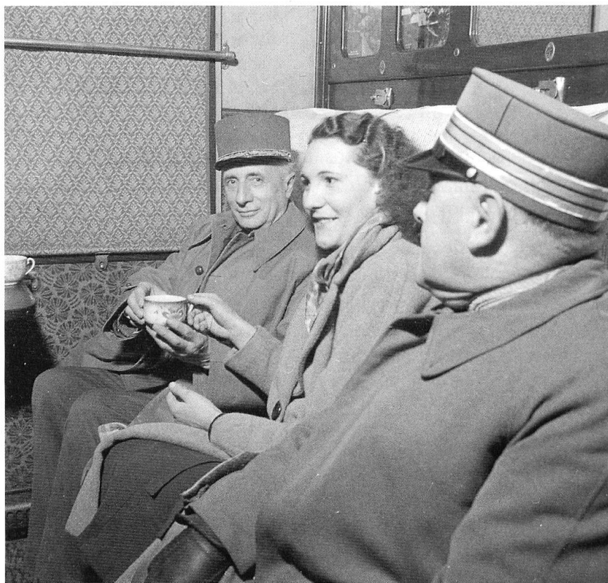
Sur une photo conservée aux Archives fédérales, on distingue le général de Lattre, une dame, vraisemblablement de la Croix-Rouge française, et le colonel Masson, chef du SR suisse, tous trois installés dans un compartiment de 1 re des CFF, le rideau baissé pour cause d'obscurcissement, dégustant une tasse de café. Cette photo, légendée d'une manière aberrante « Bahnfahrt in den Urlaub », a été prise le 26 novembre 1940 par le photographe Tièche 3 . (Archives fédérales, Berne).

La convention d'armistice franco-allemande de juin 1940 prévoit que la France conserve une force de 100000 hommes, équipée seulement d'armes légères. Le général de brigade de Lattre de Tassigny se trouve alors à l'Etat-major de l'armée d'armistice. En novembre 1940, il se rend à Berne afin de négocier le rapatriement des soldats français du 45 e corps d'armée Daille, internés en Suisse en juin