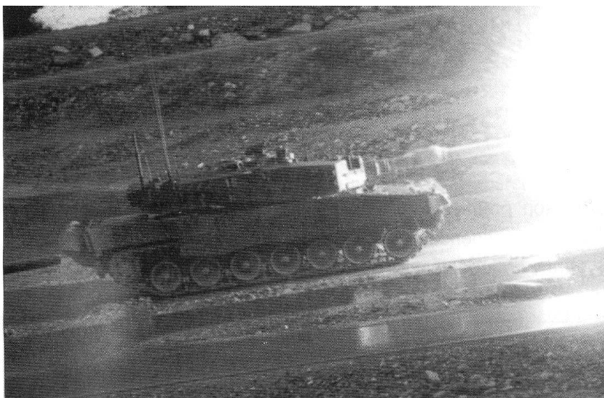
Pourra-t-on encore entretenir des formations de chars de combat? Ici un Léopard 2.

La Suisse, au cours du XX e siècle, confirme le principe énoncé par Kissinger en conférant à la «neutralité armée» une crédibilité accrue, grâce au renforcement de sa capacité de défense. L'ancien ministre de la Défense des Etats-Unis, James Schlesinger, m'a dit en 1981 que, pendant qu'il était en fonction (1973-1975), la capacité de défense de la Suisse était incontestable, et ce témoignage n'est pas unique. Les dispositions militaires de la Suisse, à l'époque de son encerclement par les puissances l'Axe entre 1940 et 1944, qui visaient à réaliser un maximum de dissuasion par la concentration des forces dans la partie montagneuse du pays (Réduit national) se sont révélées efficaces. Mais le potentiel de défense du pays atteint son plus haut niveau au cours de la guerre froide, depuis le milieu des années 1960 jusqu'au début des années 1990.