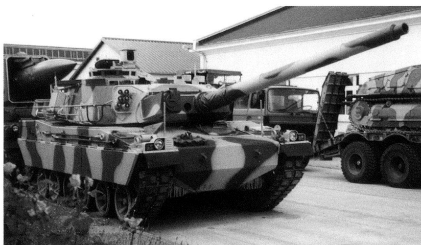
Le char de combat AMX-30.

pacité conventionnelle afin de mener à bien des interventions extérieures de plus en plus fréquentes. On va même assister à un certain découplage, au sein de la doctrine de Défense, entre l'armement nucléaire et l'armement classique, avec une autonomisation croissante de ce dernier. L'Armée de Terre va s'adapter à ce rééquilibrage entre dissuasion et action, c'est-à-dire passer d'une posture défensive de dissuasion globalement sta-