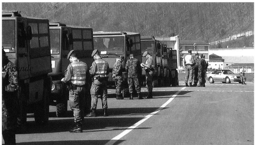
Contrôle de la circulation.