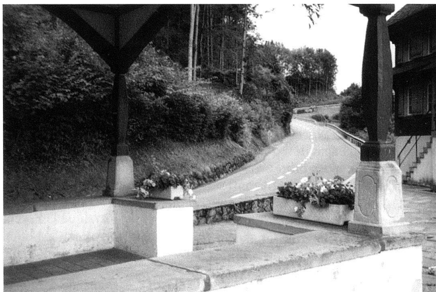
Morgarten: le défilé vu de la chapelle.

Par morale, il faut entendre la dimension éthique des acteurs, la somme des impératifs qui forment leur jugement à propos d'actes réels ou potentiels: les lois, les règles, les préceptes, la religion, les valeurs, les coutumes et les missions, donc l'héritage pratique de la culture. Les facteurs éthiques déterminent la légitimité à agir ; c'est-à-dire la possibilité morale ou la nécessité d'exercer sa volonté, ainsi que les interdits qui l'enserrent. Leur existence a durablement façonné les conflits par des principes et des codes, tacites ou non, liant l'honneur des combattants à leur comportement et formant la base de la culture militaire et du droit international. La morale avait également cours à Morgarten: si les Waldstätten n'ont fait aucun prisonnier et ainsi violé les usages de l'époque, les premières attaques ont été lancées par une bande d'exclus et de bannis tentant de se réhabiliter. Les facteurs éthiques ont gagné en importance avec l'avènement de la démocratie, reproduisant certaines réactions de la Grèce antique: alors que dix généraux athéniens vainqueurs ont été condamnés à mort pour n'avoir pas fait récupérer les cadavres de leurs hommes tombés au combat en mer, en 406 avant J.-C., un général