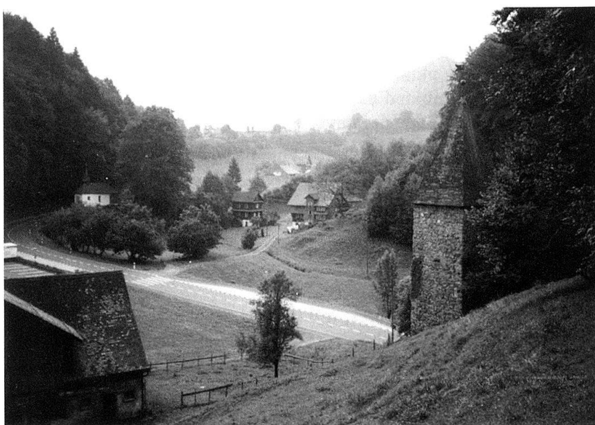
Morgarten: le défilé vu du lezzi.

brillant comme Patton a failli voir sa carrière s'achever en 1943, suite à la campagne de presse déclenchée par quelques gifles distribuées à des soldats, alors même que ses manœuvres audacieuses ont économisé des vies par milliers en France l'année suivante. Il faudra cependant attendre la généralisation de la couverture télévisée, donc