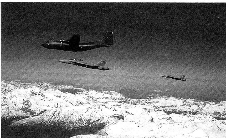
L'espace aérien, interdit au-dessus de Davos, est surveillé par des F/A-18 et des PC-7 pendant le WEF.

Même s'il ne s'agit dans la plupart des cas que de bagatelles (par exemple une erreur de manipulation), on ne peut pas négliger le fait qu'il peut vite en résulter un péril pour notre pays. La question de l'ampleur des moyens d'intervention à déployer doit être estimée du point de vue de la politique de sécurité et de l'économie. Il est clair que la Suisse accuse dans ce domaine un certain retard qu'il s'agit de combler.