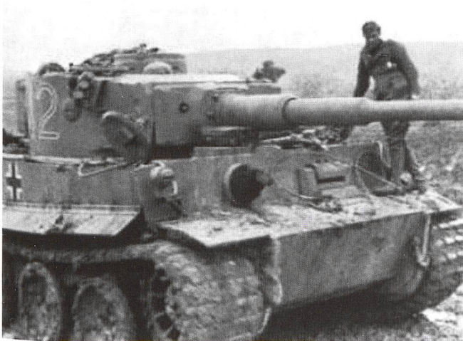
Le développement et la production de quelques centaines de chars lourds Tigre se fait aux dépens de la réalisation de plusieurs milliers de chars moyens.

industrielle, l'outil militaire repose davantage sur le matériel que sur les hommes. Un excellent pilote sans avion perd sa valeur militaire. Un excellent avion avec un pilote médiocre pourra voler même avec une capacité de combat réduite. Une mauvaise doctrine d'action affaiblit un bon matériel et des insuffisances matérielles affaiblissent une doctrine d'action. Une erreur purement doctrinale consiste dans le mauvais emploi du matériel. Ce type d'erreur, conjugué avec une mauvaise doctrine d'emploi et répercuté à l'échelle d'une armée, peut avoir des répercussions stratégiques. C'est l'erreur connue de l'Etat-Major français qui, en 1940, divise ses 3 000 chars en 100 bataillons d'accompagnement contre les Allemands qui fractionnent leurs 3 000 chars en 10 Panzerdivisionen d'exploitation de la percée. Erreur plus tactique, celle d'Hitler qui utilise le Messerschmitt 262 -premier chasseur à réaction opérationnel- dans des missions d'attaque au sol alors que son Pays est victime d'immenses raids de bombardement (1944-1945). Alors que 1 100 Messerschmitt 262 sont produits, ils n'abattent que 427 appareils alliés. La pire des stratégies des moyens est celle qui consiste à vouloir économiser le matériel au détriment des vies humaines. L'impéritie, le mépris ou des