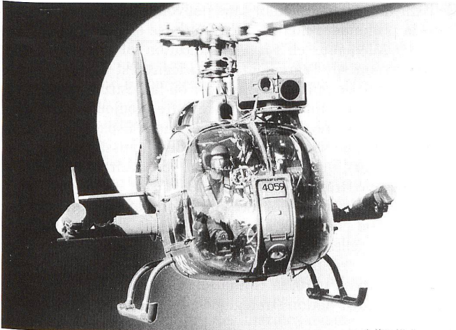
Les alliances –OTAN, Europe- permettent de mettre en commun les ressources ou de diviser les tâches. Le missile HOT en est un exemple.

neutralité aurait pu être un gage de sécurité frontalière. Les forces dispersées pour aider cet allié manquent à l'axe d'effort principal. Quand la faiblesse d'un allié se joint à sa maladresse, l'aire des conflits s'étend sur des terrains périlleux. Les aventures italiennes en Grèce et en Afrique du Nord ont dispersé l'effort de guerre allemand et ont ouvert un front Sud. Il aurait mieux valu à l'Allemagne de ne pas s'allier à l'Italie.