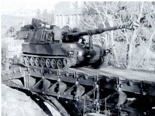
Au cours des exercices d'engagement, les aspirants vivent de manière réaliste l'engagement de leur arme et la collaboration interarmes.

de gallons »- durant la phase d'instruction en formation (VBA), qui est la dernière phase de l'Ecole de recrues. Les buts de l'Ecole d'officiers sont les suivants :