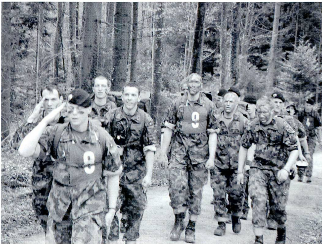
Les exercices d'endurance n'ont pas disparu, à l'exemple de l'exercice traditionnel ROTOR : 80 km de course à vélo et 5 cross, ou encore la marche des 100 km.