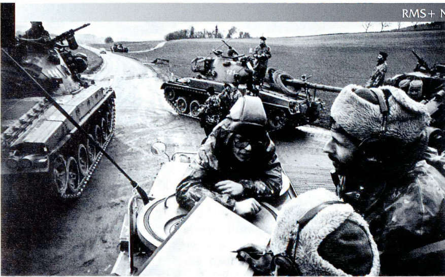
Manoeuvres de la division mécanisée 1, sur le plateau vaudois et fribourgeois.