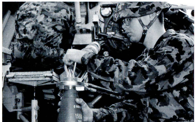
Les obus sont le cas échéant « tempés » à l'intérieur de la pièce à l'aide d'une clé.