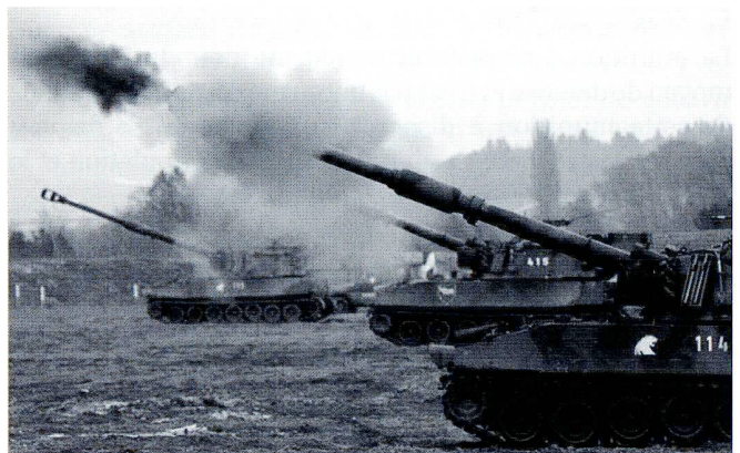
Une batterie de 6 pièces ouvre le feu. En Suisse, la munition cargo n'est pas utilisée pour les tirs d'entraînement en temps de paix.