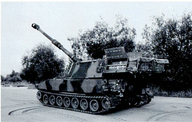
Les charges propulsives sont stockées à l'arrière de la tourelle du M-109.