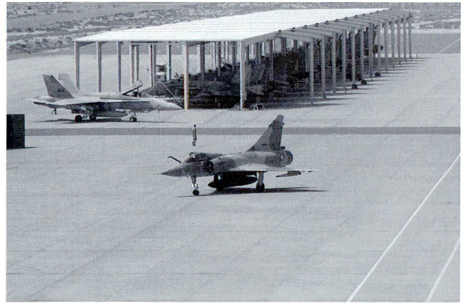
Mirage 2000C (ci-dessus) et 2000D (ci-dessous) français, en compagnie des 39 F/A-18 koweïtiens.

Se sont près de 1'300 français et un peu plus 1'000 koweïtiens qui ont participé à cet exercice. « Côté français un bataillon de 800 hommes comprenant des blindés, des unités d'artillerie sol-sol et sol-air, des éléments du génie et de la lutte chimique et nucléaire ainsi que des éléments de soutien. Il y avait également des Mirage 2000 pour l'armée de l'air. Pour ce qui est de la Marine, nous avons un groupe de anti-mines et des sections de commandos marines. Les moyens mis en œuvre par le Koweït était similaire en type et en nombre (...) » explique le Lt col. Pour ce qui est des conditions climatiques le Lt col Fusalba précise : « Très difficile et changeant. Quand nous sommes arrivés nous nous attendions à avoir très chaud. On a découvert que dans le désert la nuit on pouvait avoir très froid. Ce qui est assez exceptionnel c'est que nous