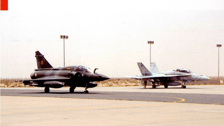
Côte à côte, un Mirage 2000D français et F/A-18D Hornet koweïtien.