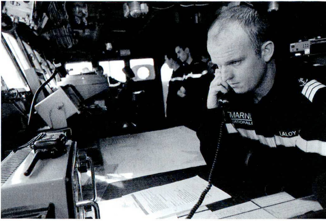
L'exercice a également impliqué les marines des deux nations.

c'est très enrichissant des deux côtés aussi bien au niveau des états-majors que pour les troupes. Parallèlement, les opérations de coopération ne se manifestent pas seulement dans ce genre d'exercice. En effet, il y par exemple la formation d'un tiers des officiers koweïtiens qui viennent se former en France. C'est donc l'occasion pour eux de mettre en pratique avec nous ce qu'ils ont eu comme enseignements ». Au final, c'est la mise en adéquation de la pratique et de la théorie à l'épreuve des faits.