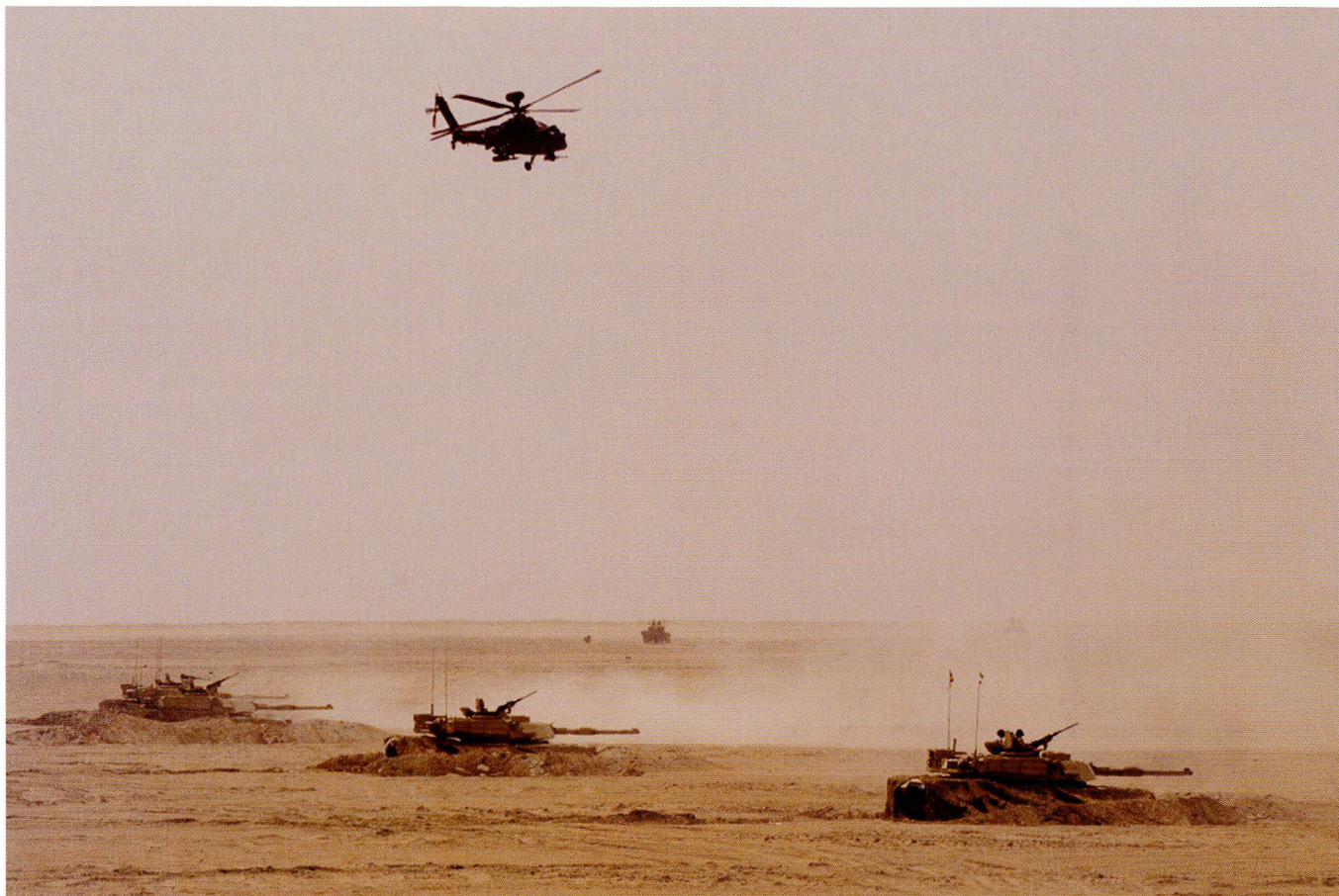
Une section de M-1A2 Abrams koweïtiens en position semi-enterrée, survolés par un AH-64D Longbow Apache. L'armée koweïtienne aligne 218 Abrams et 150 M-84D d'origine russe. 6 Apache sont en service, sur les 10 commandés.