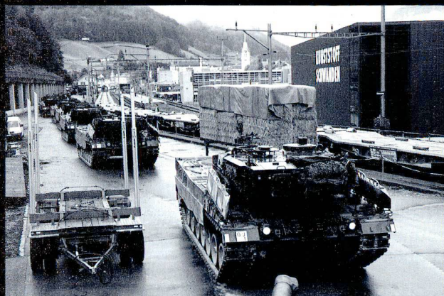
Les véhicules sont vérifiés avant le chargement.