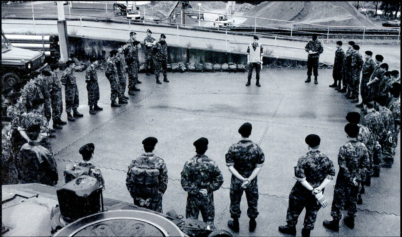
Les prescriptions de sécurité sont répétées avant le chargement sur le train.