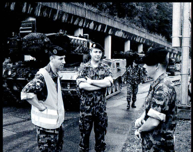
Lorsque les engins sont prêts, ils peuvent être conduits par signe sur la rampe.