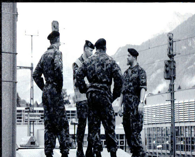
Le responsable du chargement (ici le chef chemins de fer de la br 1) oriente la troupe et prend les mesures de coordination.