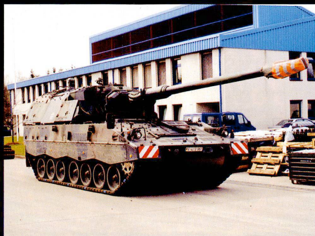
Le Panzerhaubitze 200 sert à l'appui de feu des bataillons lourds.