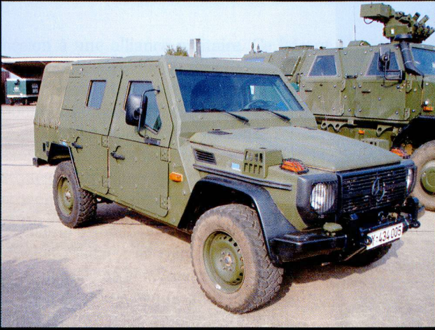
Le Light Armoured Patrol Vehicle (LAPV) Enok , sur châssis Mercedes.