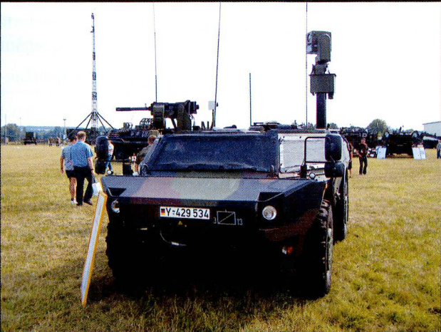
Le véhicule de reconnaissance Fenek .