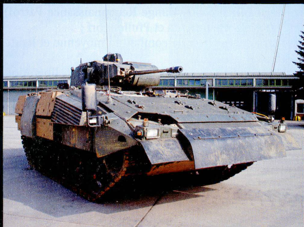
Le projet Puma vise à remplacer le VCI Marder .