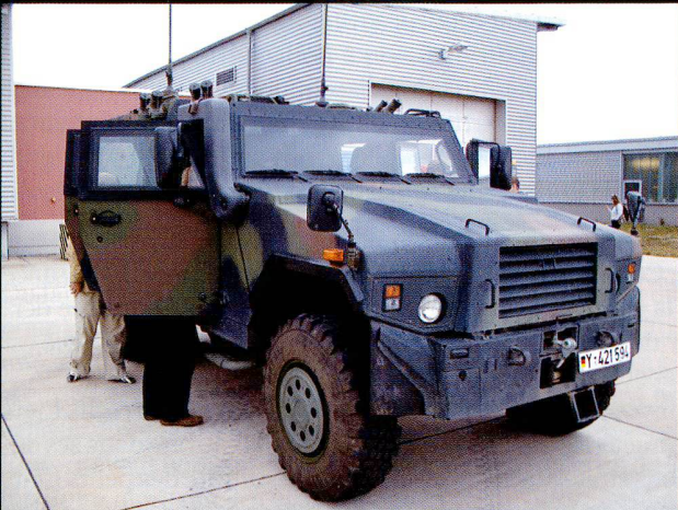
Le Mowag Eagle IV , sur châssis Duro .