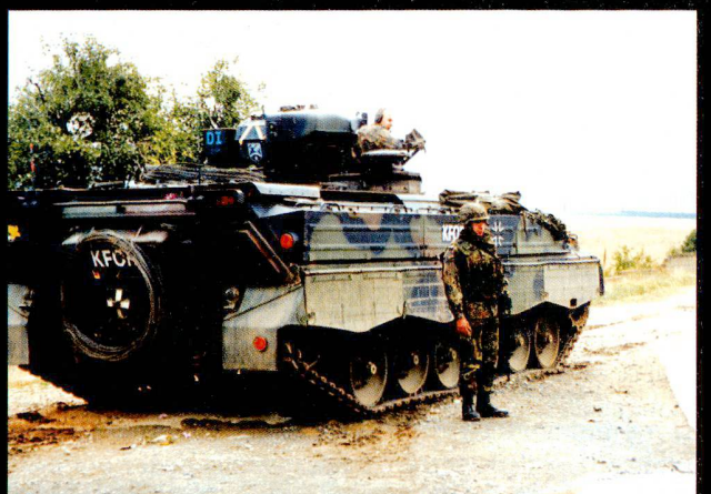
Le VCI Marder au Kosovo.