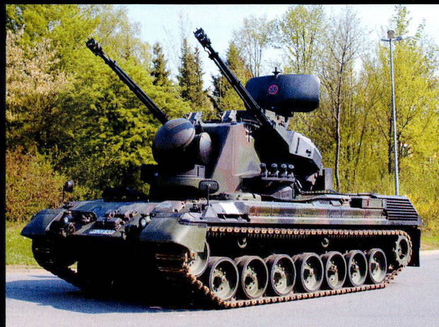
Le Gepard sert à la protection aérienne des bataillons blindés.