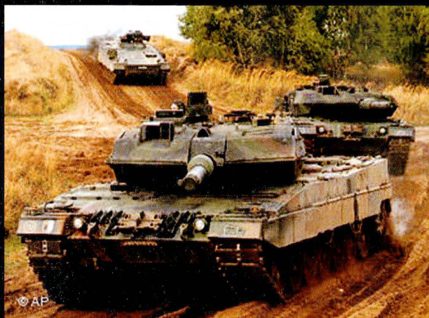
Une centaine de Léopard 2 A5/A6 équipent désormais les bataillons de chars de la Bundeswehr.