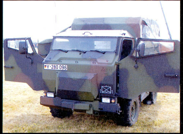
Le transport de troupes légèrement blindé Mungo .