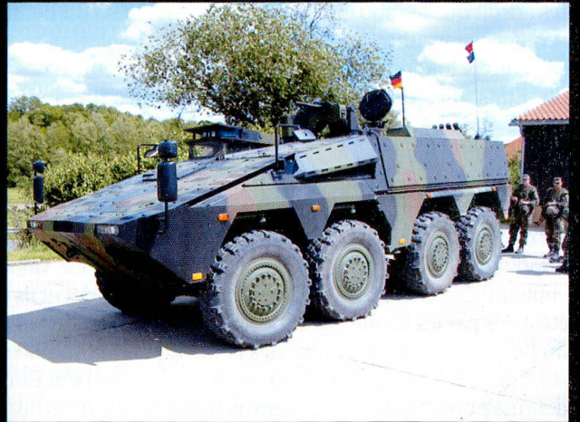
Le VTT Boxer européen.