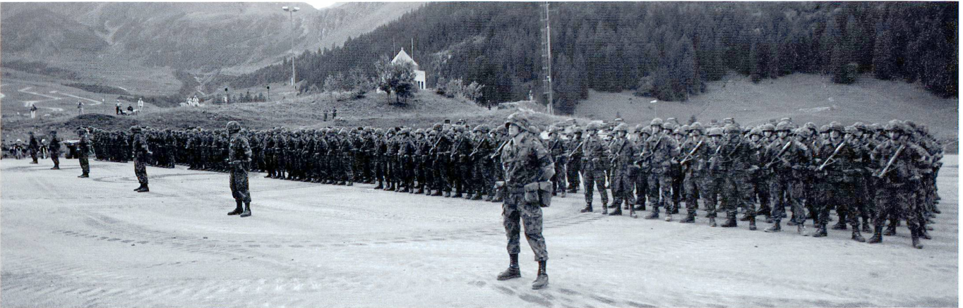
Ci-dessus et ci-dessous : remise de l'étendard, Wichlen, 25.08.2009.

d'exercice. Le 25 a été marqué par une inspection surprise d'une équipe de l'OSCE, par un tir de démonstration proposé à un public enthousiaste et averti – dont deux anciens commandants du bat chars 17. La journée s'est achevée par un défilé mécanisé (ZITADELLE) et la remise de l'étendard (ZOOK) orchestré par un adjudant de bataillon aguerri. Deux déplacements de chars (ZELZELE) ont permis à la 17/1 de rejoindre Wichlen et Hinwil, où a eu lieu la reddition et le licenciement, le 28 août.