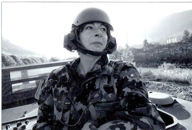
WALKYRIE : Quand on a troqué sa moto pour un Piranha , il fait quand même bon retrouver les sensations du grand air...