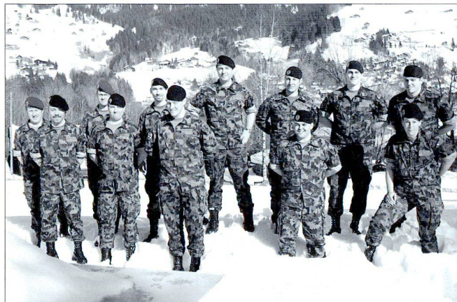
L'état-major et les commandants au complet, durant les journées de travail d'état-major 6 mois avant le CR.