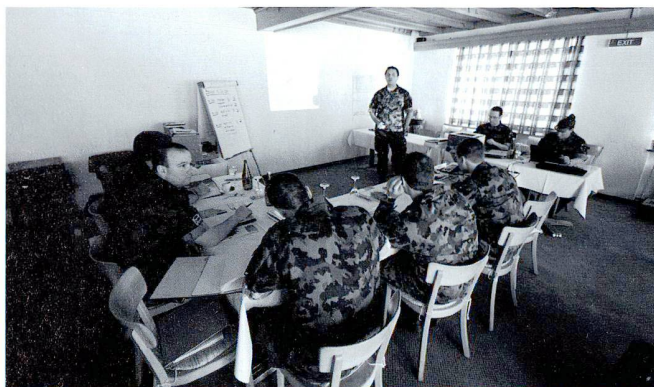
L'état-major et les commandants de compagnie préparent le CR 2009 à la Lenk.