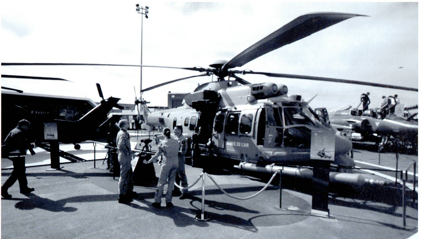
Le Cougar , renforcé et armé, est utilisé par les forces spéciales françaises pour la récupération des pilotes ou les coups de main.