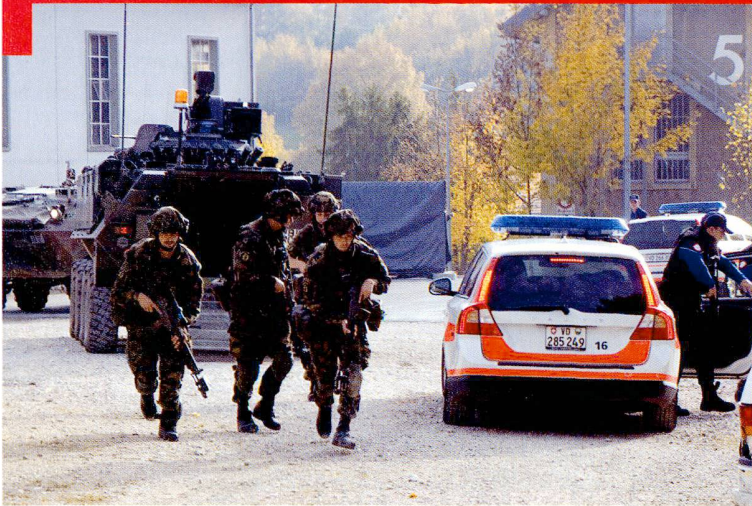
Br inf 2