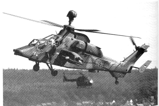
La version UHT du Tigre (PAH-1) destinée à la Bundeswehr. Il existe deux versions destinées à la France, ainsi qu'une version export du Tigre .