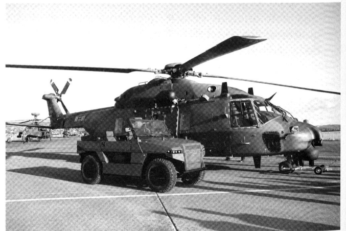
L'hélicoptère de transport NH90 est capable d'emporter des véhicules légers tous terrains.

http://www.opex360.com/2010/05/25/lallemagne-suspend-lachat-dhelicopteres-tigre/ (26.04.2010)