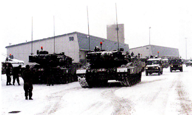
Préparation des véhicules et des simulateurs. Au vu des conditions météo, il faut s'assurer que tout fonctionne.