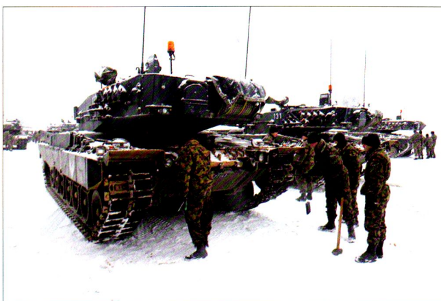
Halte, nouveau but : mettez les crampons à neige...