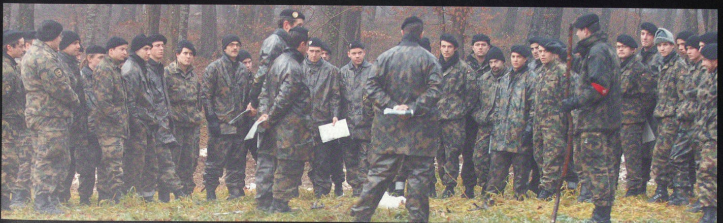
Critique de l'exercice au Bois Abandonné, sur une maquette de terrain.