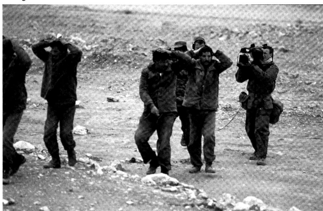
Un facteur déterminant de la guerre du Golfe a été l'omniprésence des journalistes.