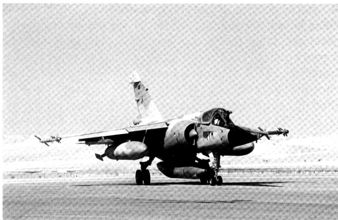
Mirage F1CR de la 33 e escadre de reconnaissance.