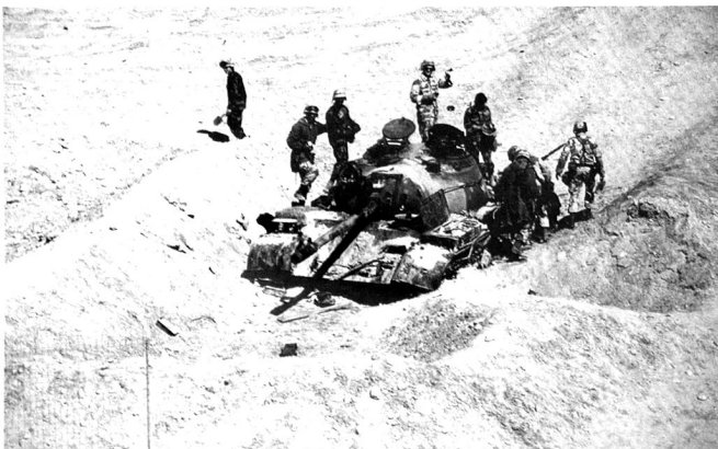
Un char irakien Type 69 (version chinoise du T-55) détruit par les forces françaises pendant la TEMPÊTE DU GOLFE.