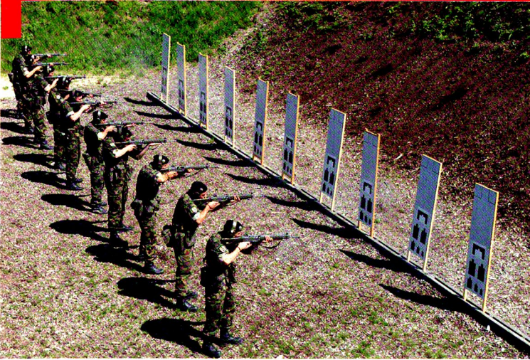
EM bat chars 17