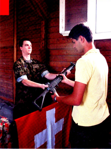
«Votre arme personnelle!».