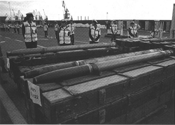
Les dangers n'ont pas disparus. Mais ils se sont transformés... et peut-être déplacés.