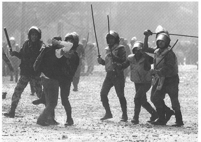
Démonstrations et engagement de forces égyptiennes à proximité de la place Tahir, au Caire.