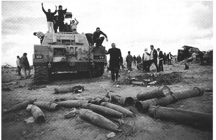
Le conflit lybien a créé de nouveaux précédents internationaux. Ses conséquences ne sont pas maîtrisées.

La rupture de la zone méditerranéenne qui se profile aujourd'hui à l'horizon, laisse-t-elle entrevoir un nouveau départ pour l'Europe ? A première vue, on serait tenté de dire non : la crise de la monnaie unique et les difficultés qui en découlent pour les grands États (France, Royaume-Uni, Italie, Espagne), le risque de désindustrialisation de l'Europe que comporte cette crise ne devraient pas s'améliorer avec l'écroulement de la façade sud de la Méditerranée... au contraire ! L'afflux de réfugiés, l'économie grise et les trafics de tous ordres qui se mettront inmanquablement en place devraient représenter un défi et une charge supplémentaires pour les États européens déjà gravement affaiblis. Dès lors, l'affaissement du sud de l'espace méditerranéen devrait surtout accentuer celui de l'Europe occidentale... dans un premier temps en tout cas ! Mais ensuite... ?