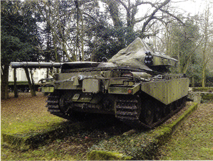
Le char 55 « en l'état » chez son ancien propriétaire, à Bellevue (GE). Il avait été acquis par un privé en 1982.