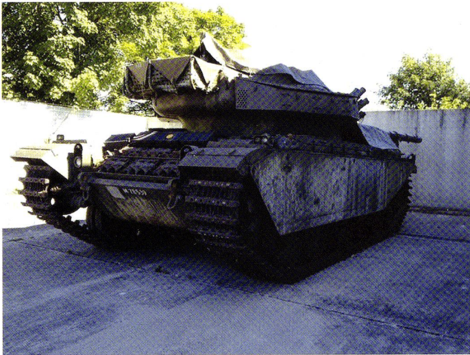
Le Centurion amené à Aïre-la-Ville, où a pu avoir lieu la restauration.