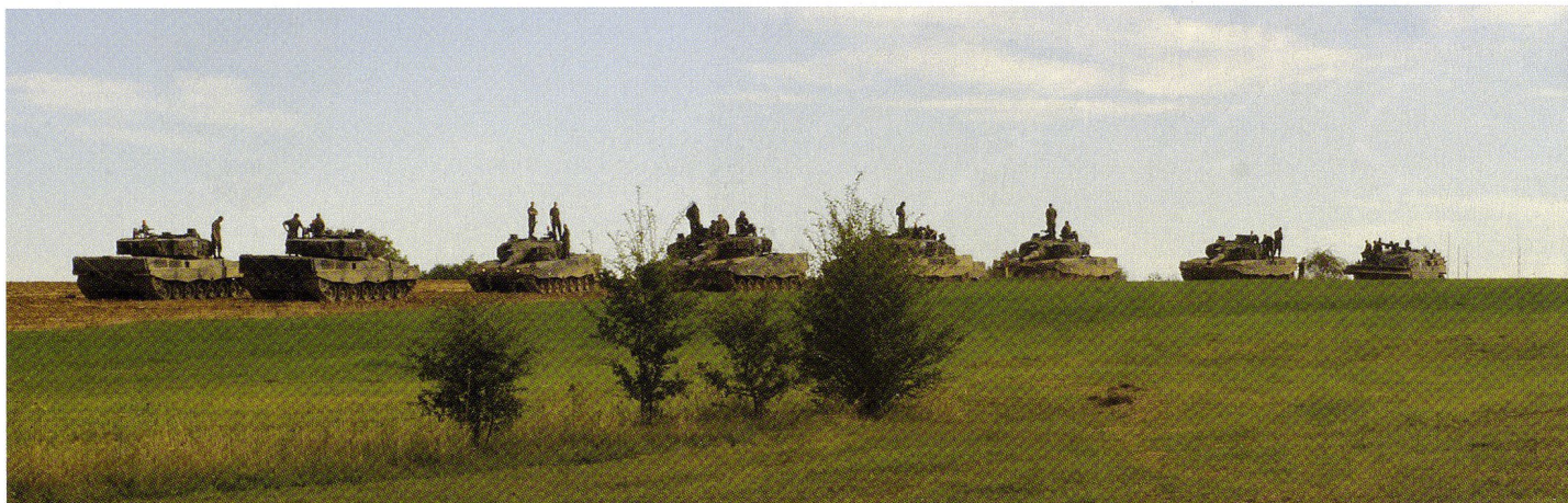
A la fin de chaque exercice est effectué une critique; puis aussitôt on se prépare pour le prochain passage.