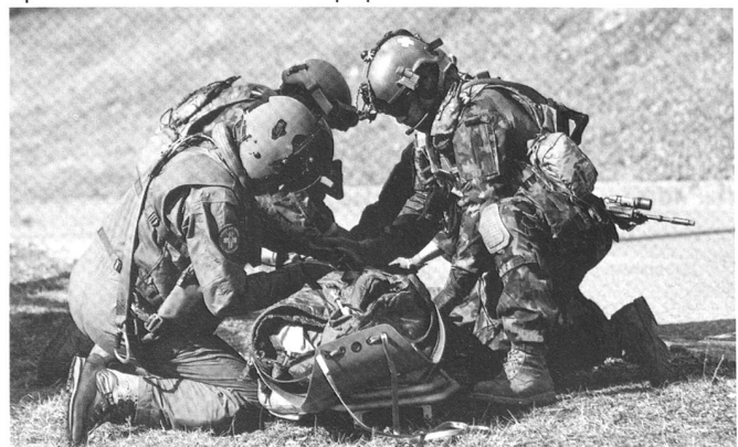
Opérateurs du DRA 10 et des FA préparant une évacuation sanitaire.