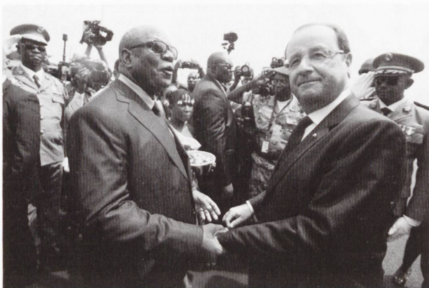
Le président malien IBK, main dans la main avec le président Français, François Hollande.

retour de la Justice et la réforme du secteur de la sécurité. » Ce n'est pas un hasard car depuis quelques temps des voix s'élèvent contre la présence étrangère sur le territoire malien. Le citoyen lambda ne comprend pas pourquoi tous ces étrangers s'installent à Bamako, que SERVAL se retire du Nord alors que l'insécurité est encore présente, que des attentats ont encore lieu – notamment à Tessalit en octobre et Kidal en décembre.