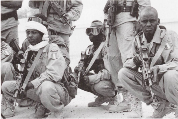
Le Tchad, pays allié de la France, a fourni plus d'un millier de soldats, sur les 3'000 militaires venus pour assurer la stabilité du Mali.