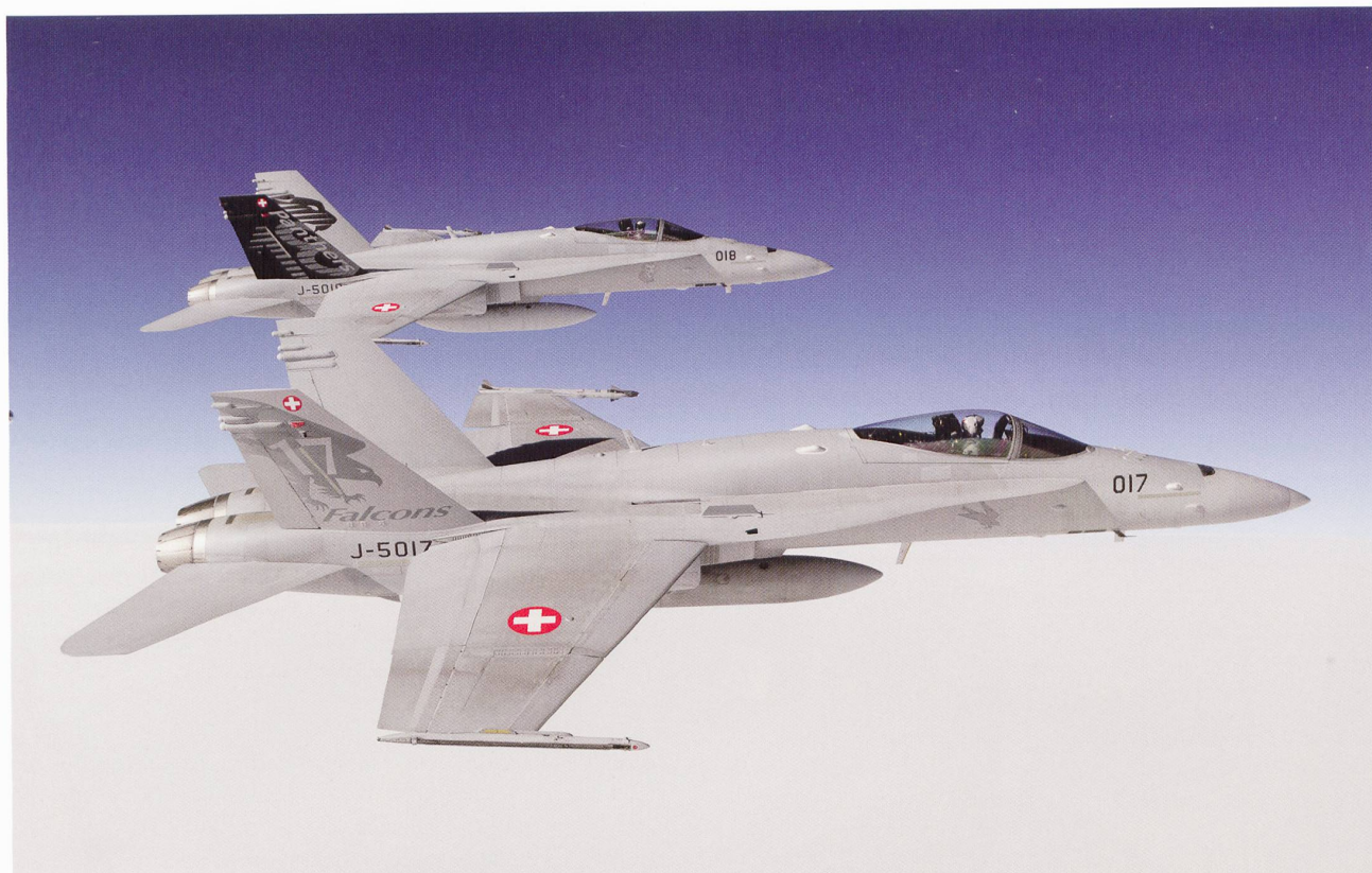
Le Faucon de l'escadrille 17 et la Panthère noire de l'escadrille 18. Super Puma SAR et sa caméra FLIR.