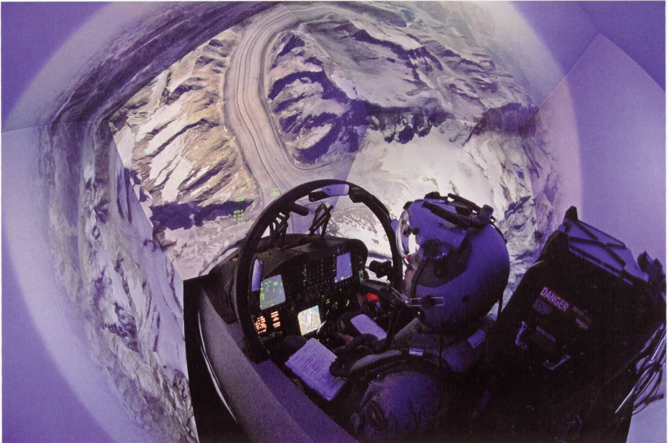
Cockpit et visuel du simulateur F/A-18.

particuliers : vol à basse altitude, vol supersonique, vol de nuit, missions tactiques à 2 ou 4, entraînement aux pannes. Tout ceci sans risques et en ne produisant aucune émission sonore. Il faut par contre mentionner que les simulateurs ne remplacent pas l'expérience du vol qui reste primordiale pour la maîtrise de l'avion.