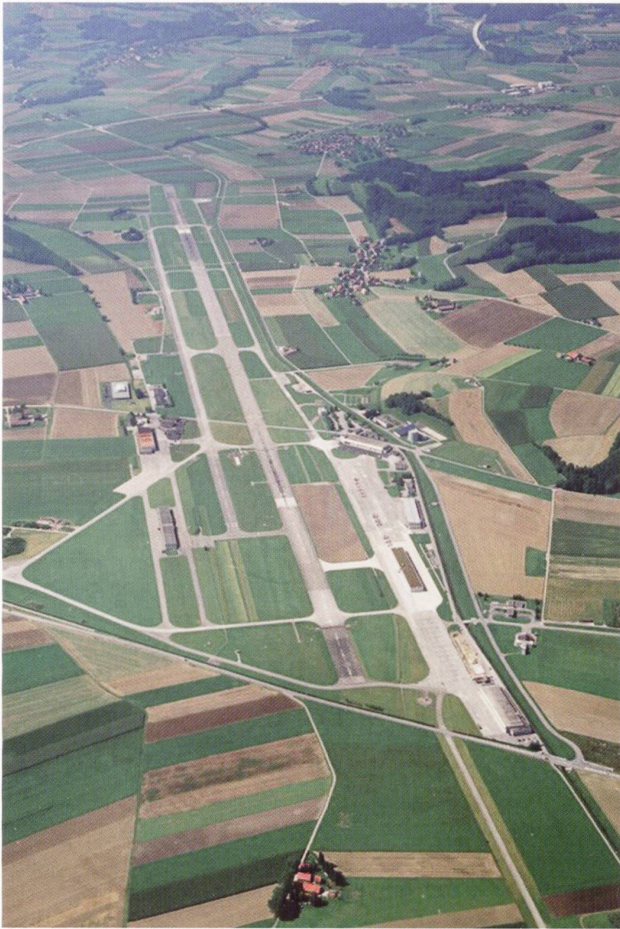
Vue aérienne de la Base aérienne de Payerne.

Aujourd'hui l'aérodrome militaire de Payerne abrite la principale Base aérienne de notre pays qui porte comme enseigne la Guêpe.