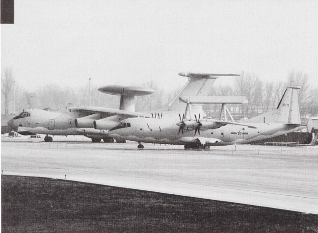
Côte à côte, le KJ-200 (premier plan) et le KJ-2000. Le premier est également décliné dans une version de surveillance électronique, baptisée Y-8.