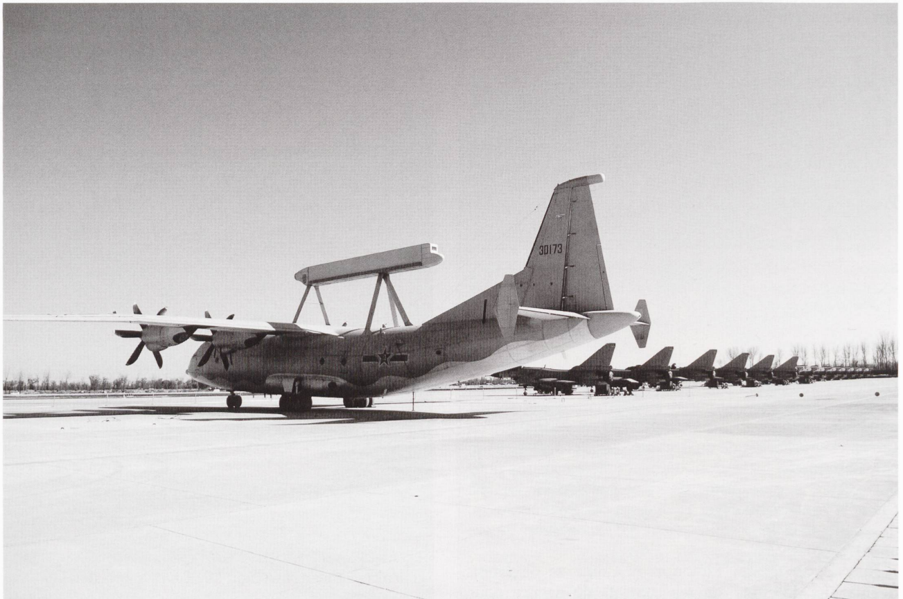
Un J-200 aligné à côté d'une rangée de chasseurs J-10.

http://forceandpolitics.wordpress.com/2010/12/25/plaaf-capabilities-and-limitations-a-critical-analysis/