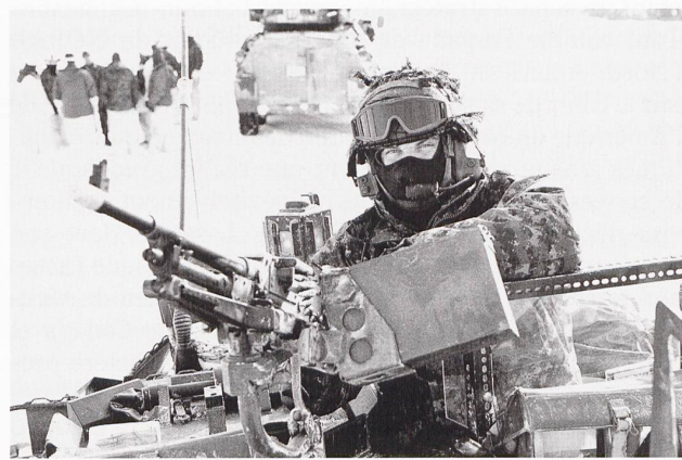
Une mitrailleuse C6 (FN MAG) est montée sur le toit de ce Coyote de reconnaissance, du 21 Troop, Royal Canadian Dragoons.