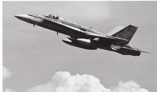
Depuis 1982, 98 CF-18A et 40 CF-18B ont servi au sein des Forces aériennes canadiennes. 17 ont été perdus depuis 1984 et 77 sont encore actifs, répartis à Bagotville au Québec (3 Wing) et Cold Lake en Alberta (4 Wing).

intitulé Stratégie pour le Nord du Canada fait état l'impératif de sécurité comme étant un des objectifs principaux visés 9 par le développement économique.