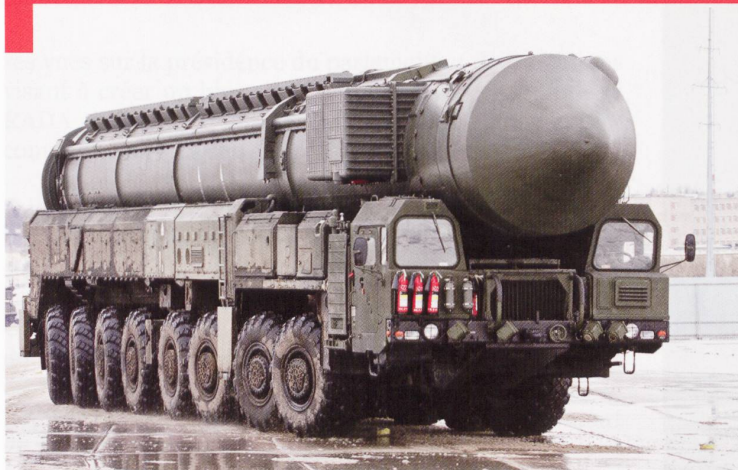
Le RT-2UTTKh Topol-M (nom de code OTAN SS-27 Sickle B ) est un missile balistique intercontinental mobile, d'une portée de 11'000 km. Il emporte une ogive unitaire de 800 kilotonnes.