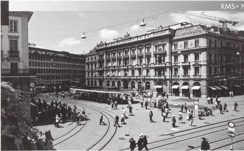
Le quartier des banques, à Zurich. Cet article a été à l'origine rédigé pour l'ASMZ. Il paraît ici avec l'aimable autorisation de son rédacteur en chef.