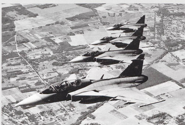
La Hongrie et la République tchèque utilisent actuellement le JAS39 Gripen , en leasing.