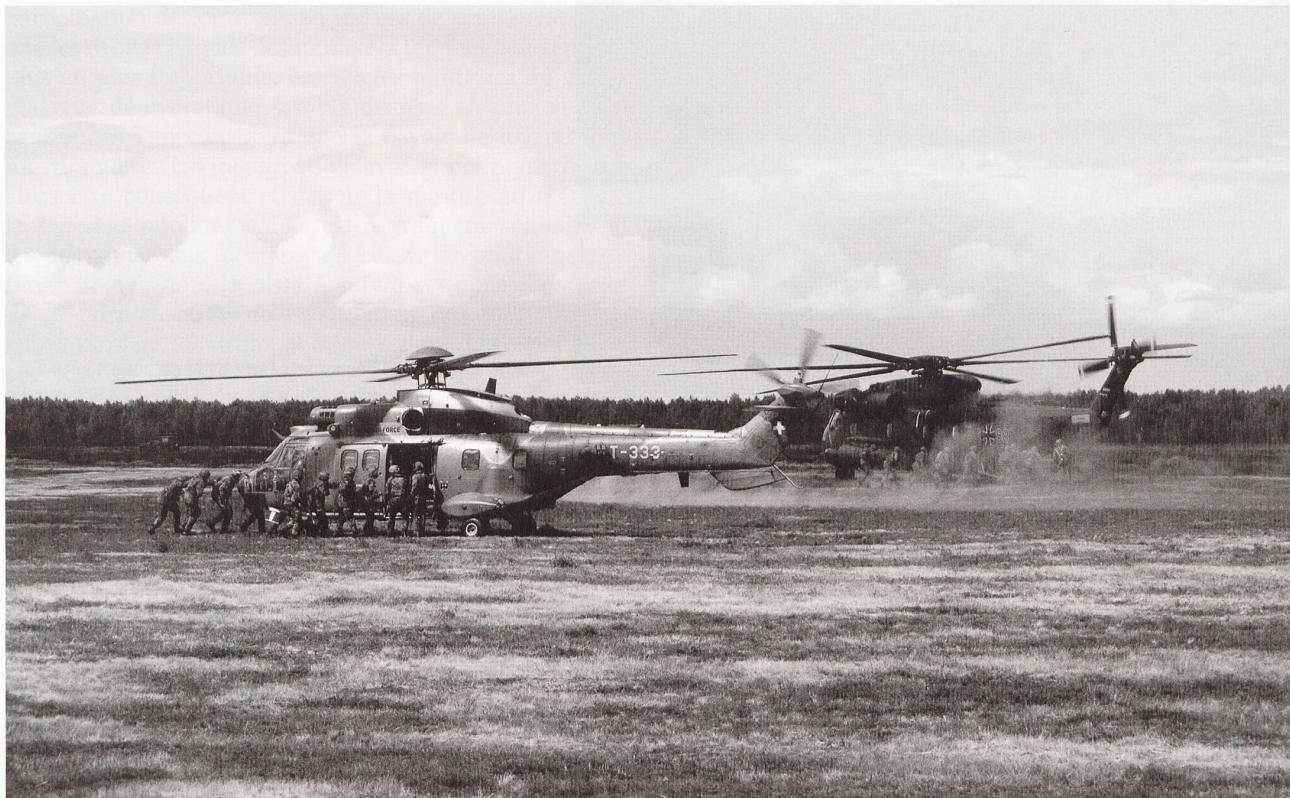
Embarquement de troupe sur Cougar (CH) et CH53 (D).

et sur la mer. Ceci, afin de remplir les missions assignées tout en garantissant un support mutuel optimal. Le scénario, fictif et quelque peu complexe, se basait sur une situation politique initiale qui a révélé, par un pur hasard, d'étonnantes similitudes avec des situations d'actualités.