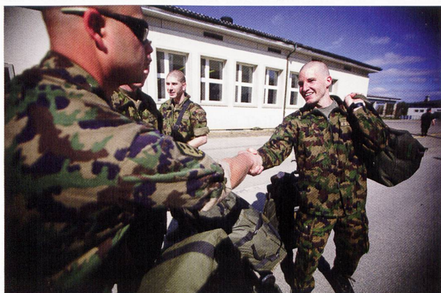
Les hommes du bat chars 17 à l'entrée en service.

La camaraderie, l'entraide, la responsabilité et la loyauté sont des valeurs fondamentales au service militaire.