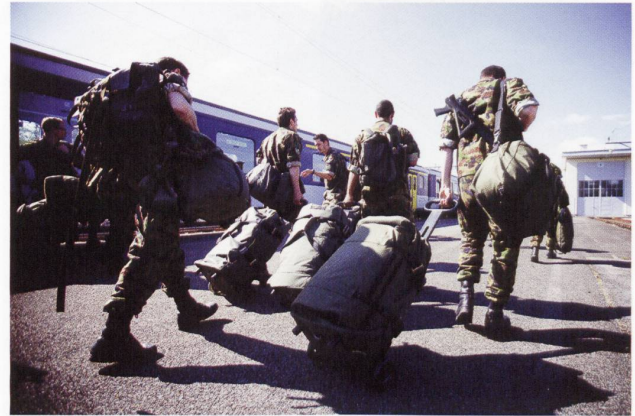
Arrivée à Bure en train sous un soleil radieux.

plus je développe de l'amour pour l'autre. Voilà une voie d'ouverture, d'appartenance au groupe, souvent couronnée de succès.