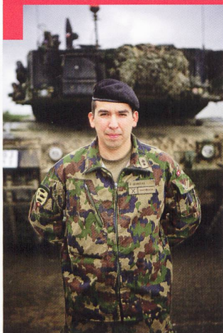
Bat chars 17