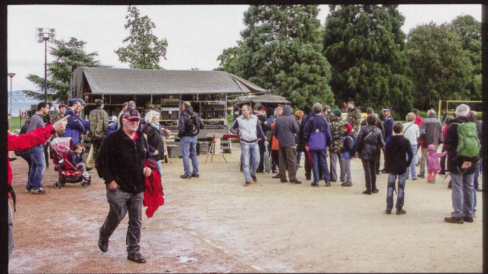
Un magnifique défilé dans les rues de Neuchâtel et une présentation des moyens techniques du Génie. Le bat G 2 a également été responsable de la construction de plusieurs artèplages en 2001-2002 lors de l'Expo 02.